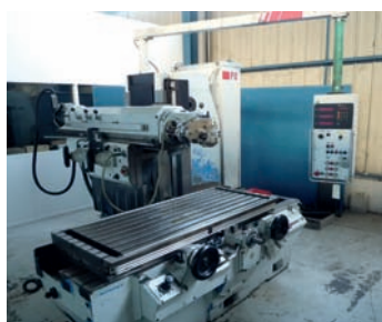
AV Fraiseuse HURON PU 551 - Année 1984 Surface de la table : 1635 x 700 mm - Courses XYZ : 1300 x 1000 x 1000 mm - Nombre de vitesses de broche : 27 - Gamme des vitesses : 30 à 2066 tr/min - Cône de broche : SA 40 + Visu 3 axes Heidenhain - Variateurs d'avances Tél : 04 77 73 00 82 AV Fraiseuse ALCERA 6 S - 640 x 230 x 430 Très bon état - Tél : 07 98 20 50 72