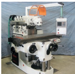
AV Fraiseuse HURON MU 5 - Visue - Variateur Courses : 1300 x 700 mm - Tél : 06 63 65 11 01 AV Fraiseuse CORREA FP 60 - Axe X : 5000 mm Axe Y : 3300 mm - Axe Z : 1000 mm / 200 mm CN Heidenhain 415 - Tél : 07 70 84 51 43