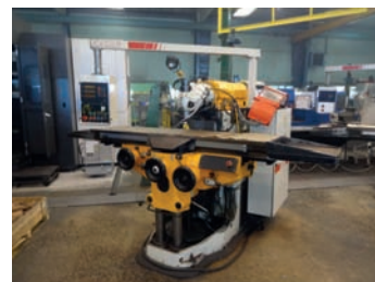
AV HURON MU6 à variateur - Année 1989 Visu 3 axes Heidenhain - Armoire télémechanique Excellent état - Tél : 06 88 94 32 50 Mail : info@mfl-industrie.com