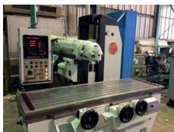
AV Fraiseuse banc fixe HURON PU 771 - Visue Table : 2235 x 700 mm - Tél : 06 63 65 11 01