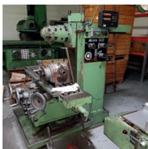
AV Fraiseuse ALCERA 803 - Courses : 800 x 400 x 350 - Tél : 03 88 72 02 47 AV Fraiseuse CORREA A 16 - Heidenhain TNC 415 - Table : 2000 x 630 mm - Courses : 1600 x 800 x 800 mm - Tél : 06 63 65 11 01