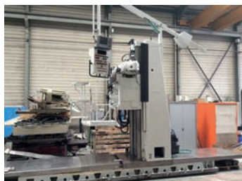
AV Fraiseuse HURON LU - Visue - Cap : 4000 x 1000 x 2000 mm - Table rotative - Taques Tél : 06 63 65 11 01