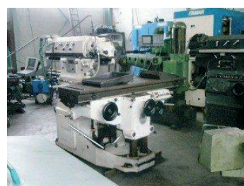
AV Fraiseuse HURON MU4 avec variateur Refaite - Repeinte - Nouvelle visu Heidenhain TBE - Tél : 03 88 72 02 47 AV Fraiseuse CORREA FP 40 - Axe X : 4000 mm - Axe Y : 3000 mm - Axe Z : 1000 mm / 1500 mm - CN Heidenhain - Tél : 07 70 84 51 43