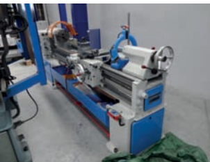
AV Tour CAZENEUVE HB 500 x 2000 mm Excellent état - Aux normes Tél : 06 88 94 32 50 Mail : info@mfl-industrie.com