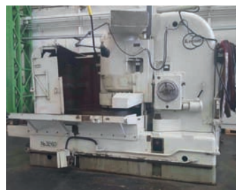
AV Rectifieuse plane BLANCHARD - Table magnétique : 1500 mm - Tél : 06 63 65 11 01