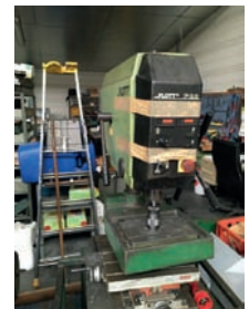
AV Perceuse d'établi FLOTT P23 - Avec table croisée - Tél : 03 88 72 02 47