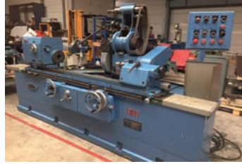
AV Rectifieuse inter exte Construction de Clichy - Type 5023N - Hauteur de pointes : 190 mm - Entre pointes : 1000 mm - Appareil intérieur basculant - Diamètre maxi rectifiable : 370 mm - Diamètre de meule : 455 mm - Largeur de meule : 80 mm - Lunette 3 touches - Lunette 2 touches - Plateau - Porte diamant rabattable - 2 portes meules - Bac d'arrosage avec système de démagnétisation Prix : 7 500 Euros HT - Tél : 06 07 68 86 74 ou 01 34 08 42 44