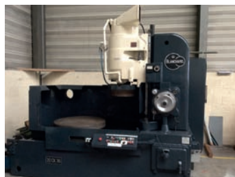
AV Rectifieuse plane BLANCHARD - Table magnétique de 1200 mm et 920 mm Tél : 06 63 65 11 01