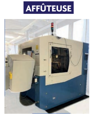
AV Affûteuse d'outils 5 axes simultanés SCHNEEBERGER CORVUS pour fraise, fraise-mère - Arbres cannelés - Broches exte ou inter - CN Fanuc - X 450 x Y 300 x Z 300 mm - A rotation libre et C 370° - Double broche HSK-50 jusqu'à 6 meules - 10/15 Kw Rotation : 1000 à 9000 tr/min - Année 2000 Tél : 06 88 94 32 50 Mail : info@mfl-industrie.com