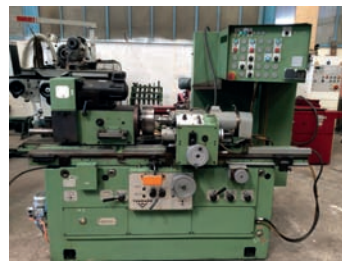
AV Rectifieuse inter VOUMARD 5 - Cap : 250 mm - Tél : 06 63 65 11 01