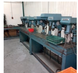
AV Banc de perçage CINCINNATI - Avec 4 perceuses taraudeuses - TBE - Prix : 4 000 Euros - A débattre - Tél : 03 88 72 02 47