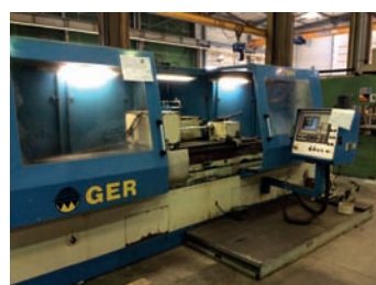
AV Rectifieuse cylindrique GER C 2000 - CNC Fagor - Capacité : 2000 x 380 mm Tél : 06 63 65 11 01