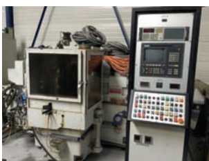
AV Rectifieuse double meules GIUSTINA R 226 - CNC Siemens - Meules : 660 mm Tél : 06 63 65 11 01