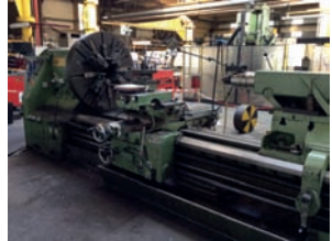
AV Tour SCULFORT Supercap 650 - Visue Cap : 2500 x 1300 mm - Alésage : 260 mm Tél : 06 63 65 11 01