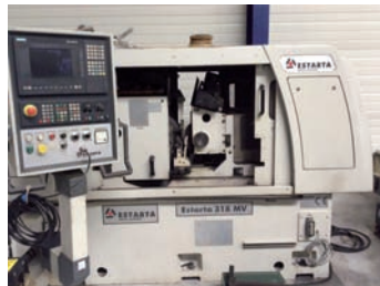
AV Rectifieuse centerless ESTARTA 318MW Année 1999 - CNC Siemens Microrex 1H - 1991 Tél : 06 63 65 11 01