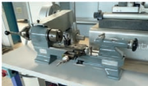
AV Tour conventionnel SCHAUUBLIN 70 sur établi - Passage sur le banc : 130 mm - Distance entre pointes : 275 mm - Armoire électrique neuve - Chariot croisé - Machine en très bon état - Tél : 04 77 73 00 82