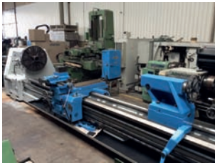
AV Tour SCULFORT Supercap - Capacité : 6000 x 1140 mm - Lunettes - Tél : 06 63 65 11 01