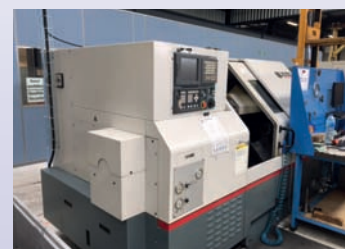
Tour CNC CINCINNATI Hawk 200 De 1998 - TBE Dia 290 x 500 EP - Axe C Outils motorisés CNC Fanuc