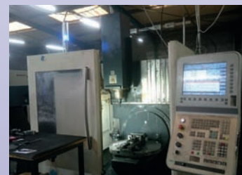
CU 5 axes DMG DMU 50 Eco De 2012 Siemens 810D Shopmill