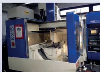
CUV 5 axes HURON KX 15 De 2002 CNC Siemens 840D Shopmill Courses 1000 x 800 x 550 mm