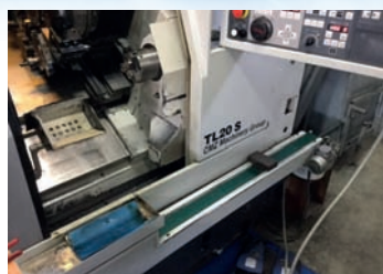
Tour CNC CMZ TL 20S De 2008 Avec contre broche TBE