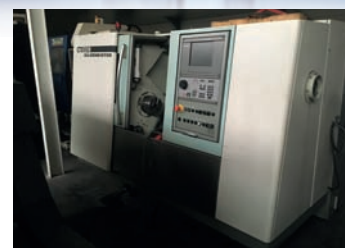
Tour CNC DMG CTX 310 De 2004 Axe C Outils motorisés Dia 360 x 650 EP