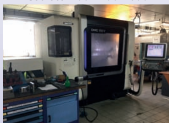
CUV DMC 850 De 2016 Courses 850 x 600 x 600 14 000 tr/min - Heidenhain 640 Super état