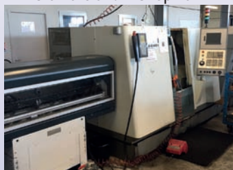
Tour CNC DMC CTX 210 De 2003 Axe C - Outils motorisés Magasin à barres CNC Fanuc 21 iTB