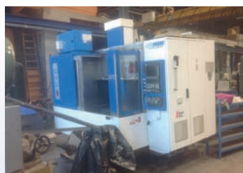
CUV HURON KX 8 De 2002 CNC Siemens 840D Shopmill Courses 800 x 700 x 500 mm