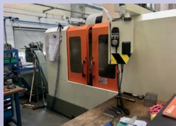
CUV VICTOR VC 102 De 2011 Courses 1000 x 600 x 580 15 kW - 8000 tr/min CNC Fanuc Oi Mate MD