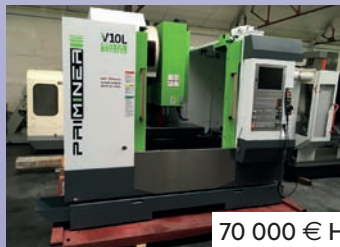
CUV PRIMINER DELTA V 10 L De 2017 Courses 1050 x 520 x 550 - HP CNC Fanuc TNC 620 Machine neuve avec garantie 1 an