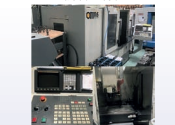
CUV HARTFORD VMC 1250 De 2005 Courses 1250 x 600 x 600 CNC Fanuc