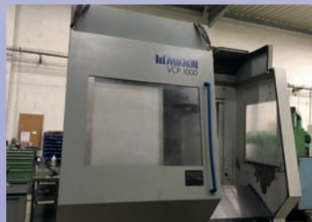
CUV MIKRON VCP 1000 De 2000 Courses 1000 x 700 x 700 TNC 430 Heidenhain