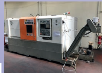
Tour VICTOR VTurn 26 De 2008 CNC Fanuc 21 iTB Entre pointe 850 mm