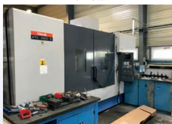
CUV MAZAK VTC 300 II De 2002 Fusion 640M 4ème axe Nikken Courses 1700 x 700 x 600