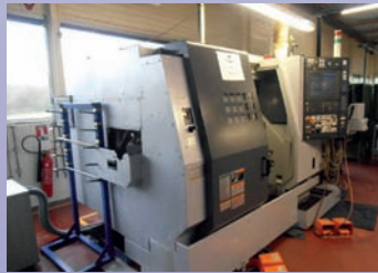
Tour CNC MORI SEIKI ZT 1500 SY De 2005 Bi broches Bi tourelles CNC Fanuc