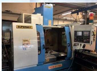
CUV YCM Supermax V 116A 1100 x 600 x 630 mm CNC control Fanuc OIM