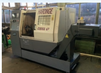
Tour CNC HARDINGE Cobra 42 De 1998 Fanuc 21 T 2 axes - Dia 280 x EP 400 mm Bon état