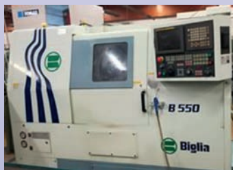
Tour BIGLIA B 550 De 2005 CNC Fanuc 21 I Dia 500 x 550 mm TBE